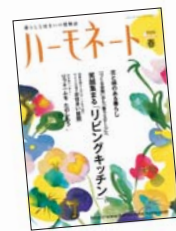
ハーモネート誌 ハーモネート ショッピングクラブ

快適な暮らしのヒントが詰まった「ハーモネート誌」や住まいのお手入れやリフォーム情報が満載の「ハーモネートタウン」など、情報誌やインターネットを通じて住まいと暮らしの情報をお届けしています。